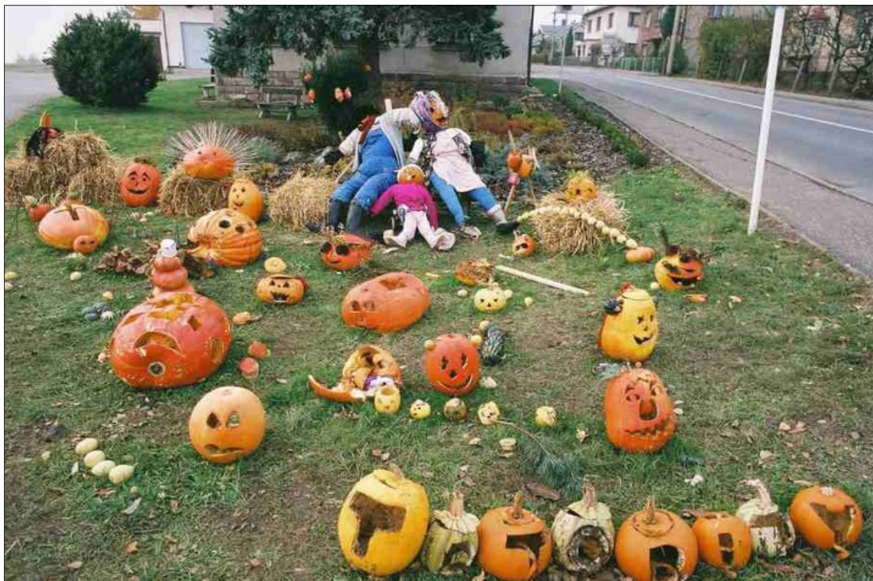
Listopad v Tatobitech