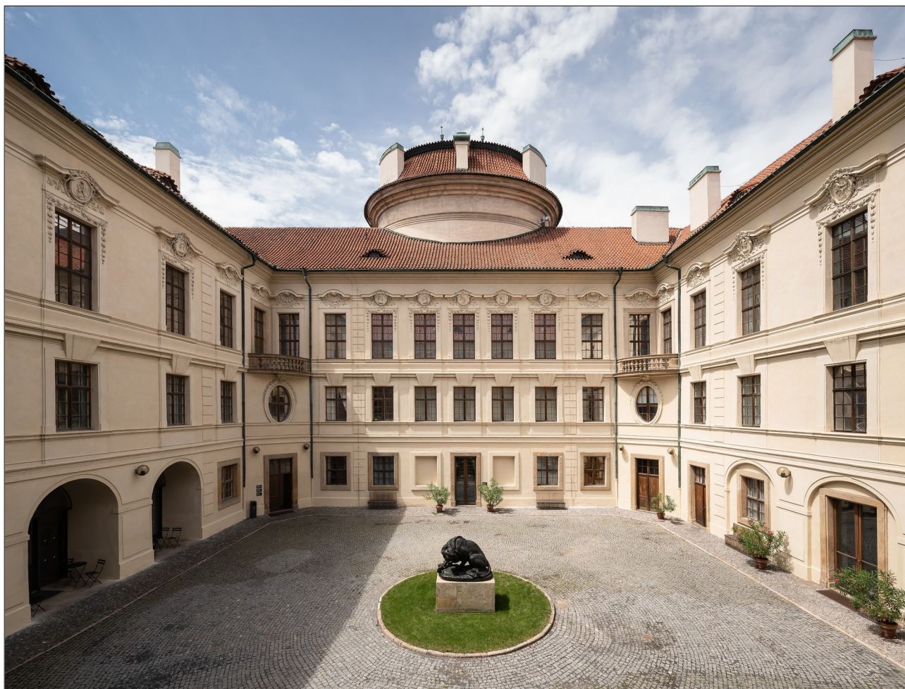
Schwarzenberský palác

NGP také spouští novou variantu vstupného pro oba výše zmíněné paláce na Pražském hradě – od nynějška lze v pokladnách koupit společnou vstupenku do obou míst s expozicemi Staří mistři za 300 Kč (oproti dosavadním dvěma vstupenkám za 180 a 250 Kč).