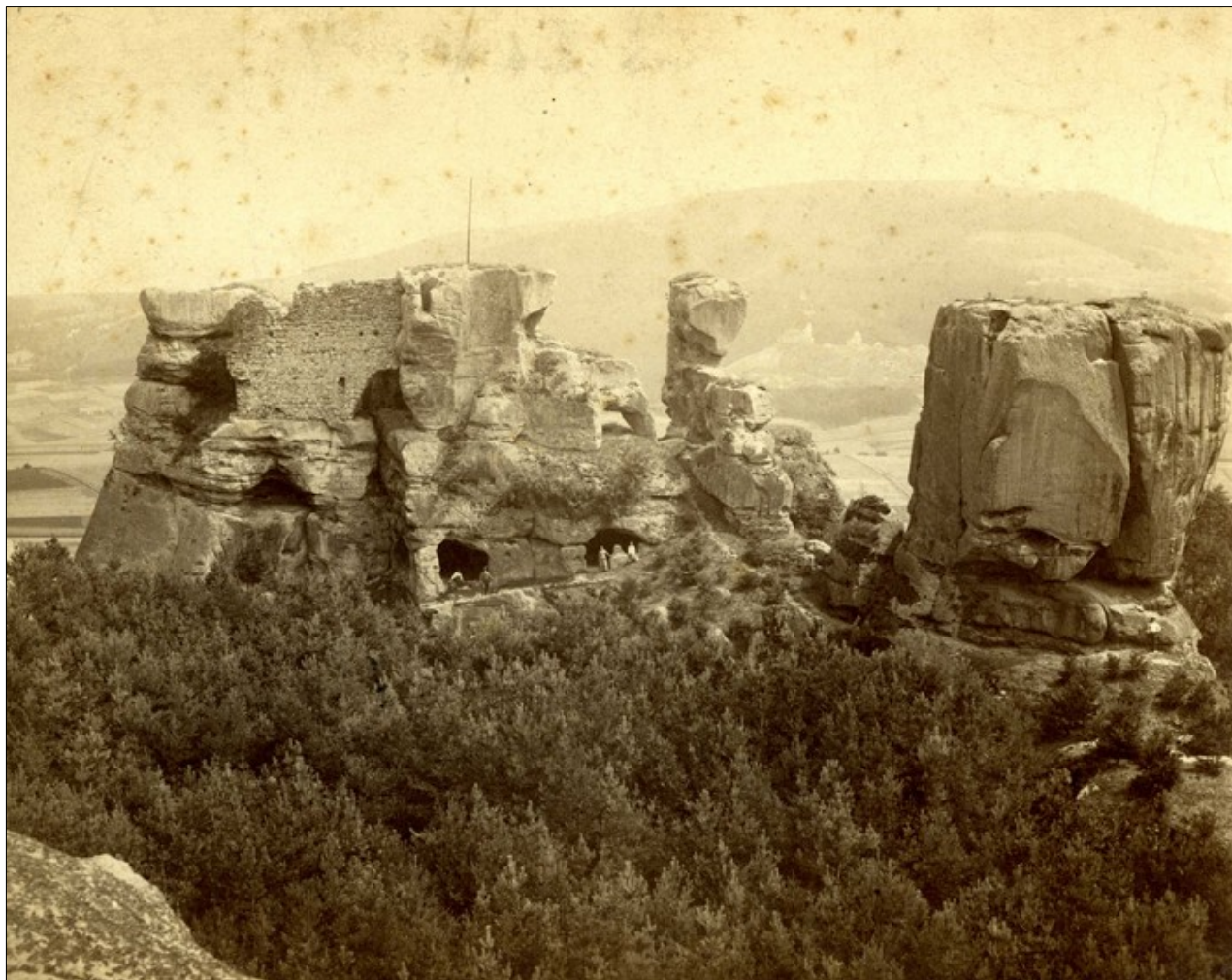
Josef Pekař: Hrad Rotštejn, 1920