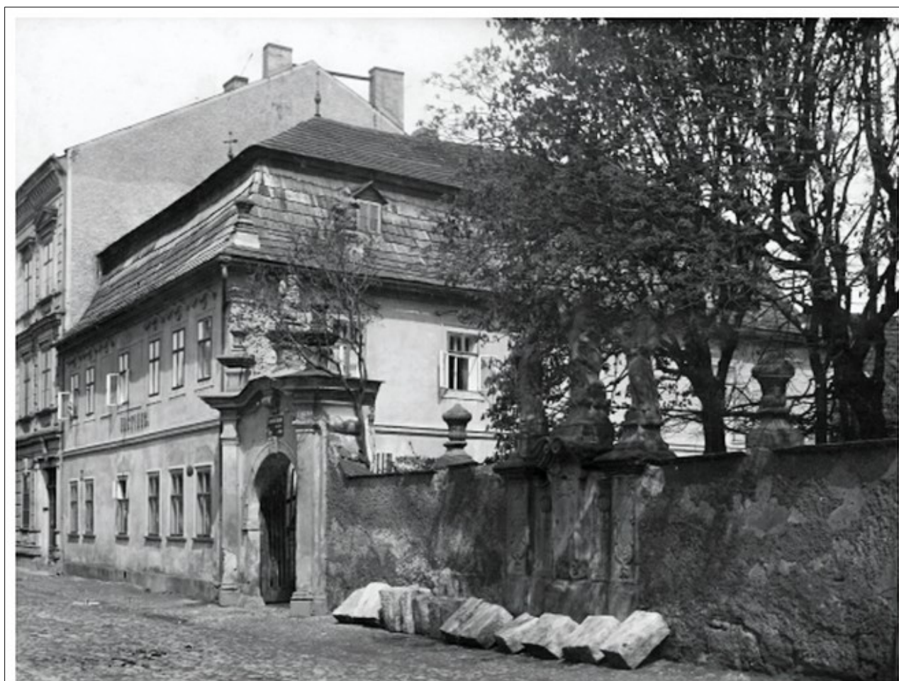
Hostinec a sousoší sv. Václava, sv. Jana Nepomuckého a sv. Antonína Paduánského. Konec 19. století