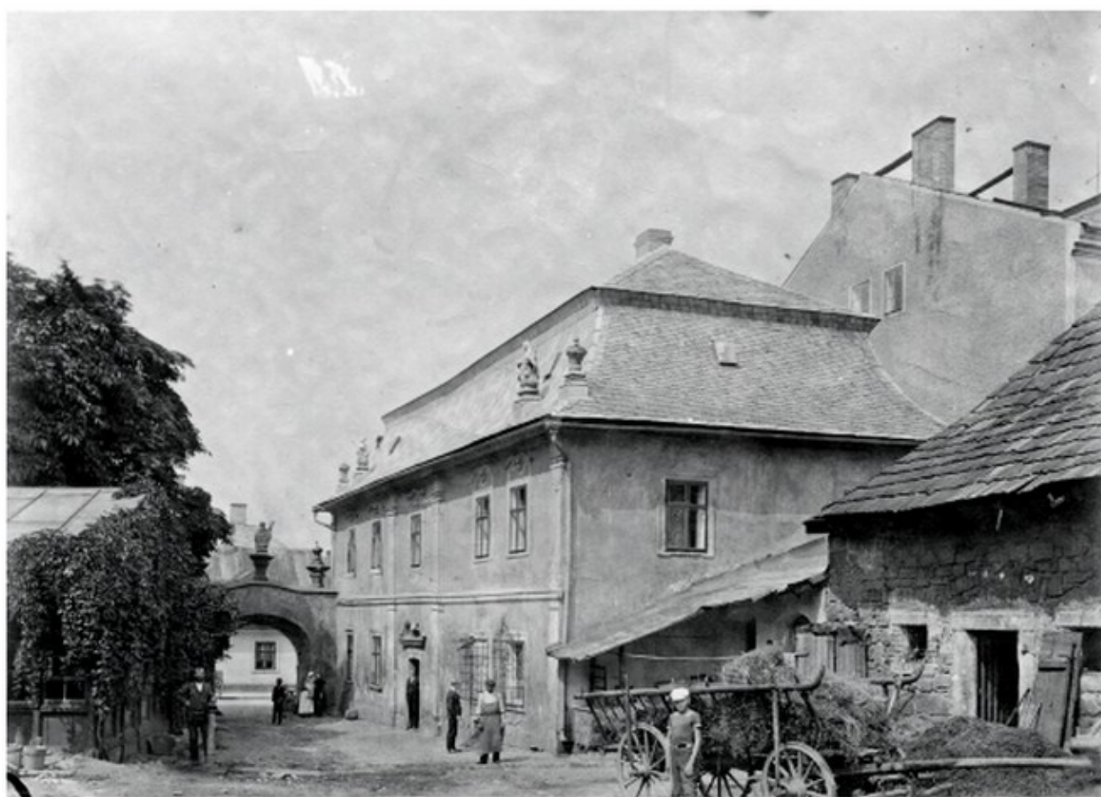
Dvůr hostince s venkovním posezením (vlevo) a stájemi (vpravo). Konec 19. století

Jednalo se o podnik U Bažanta (čp. 70), kde je v současnosti administrativní část muzejních budov. Patrový dům s mansardovou střechou, k jehož jižní straně přiléhá zahrada v prostoru domu zaniklého již za třicetileté války, představuje unikátně dochovanou památku, která vznikala od konce středověku až do 20. století. Stávající hmota objektu vychází z barokních přestaveb a do dnešních dnů zůstala téměř beze změn. Velmi cenná je fasáda do ulice v pozdně barokní úpravě druhé poloviny 18. století a pískovcový portál nacházející se na místě vstupu do domu za průjezdní bránou.