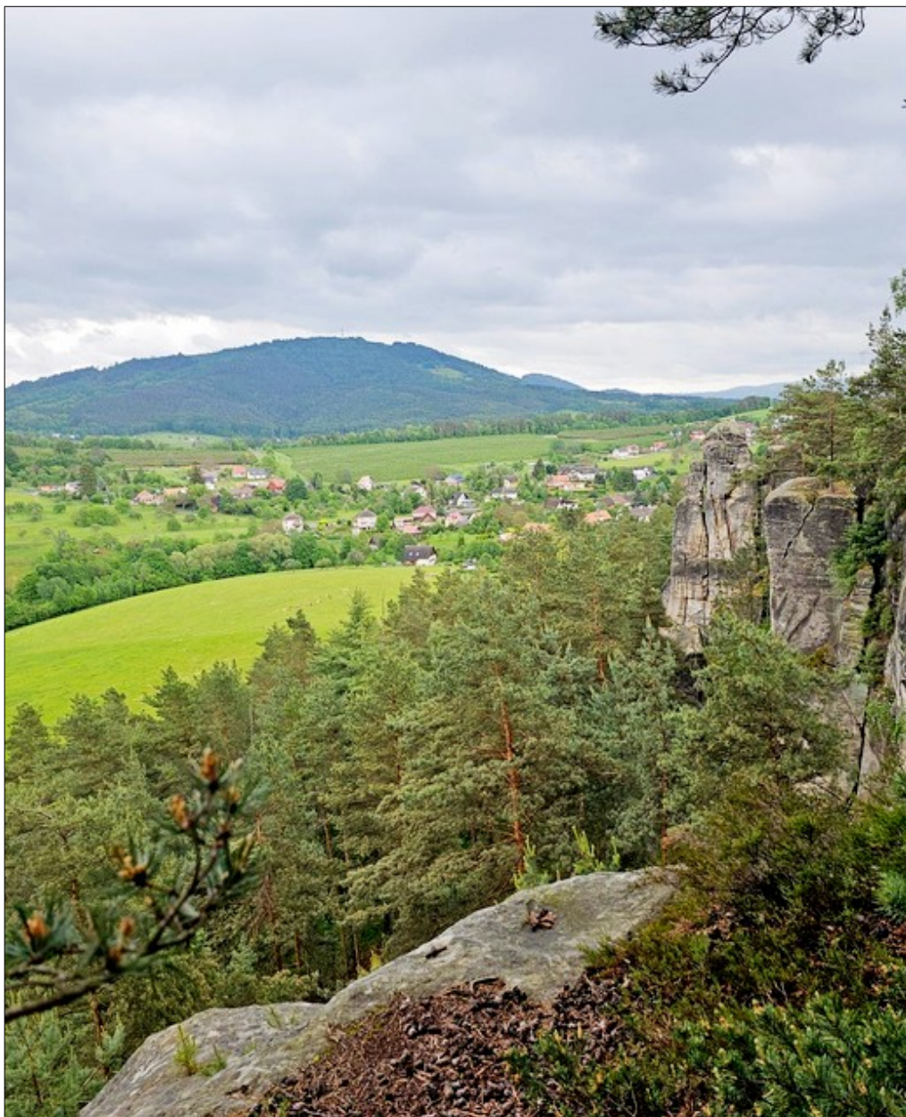
Z Klokočských skal