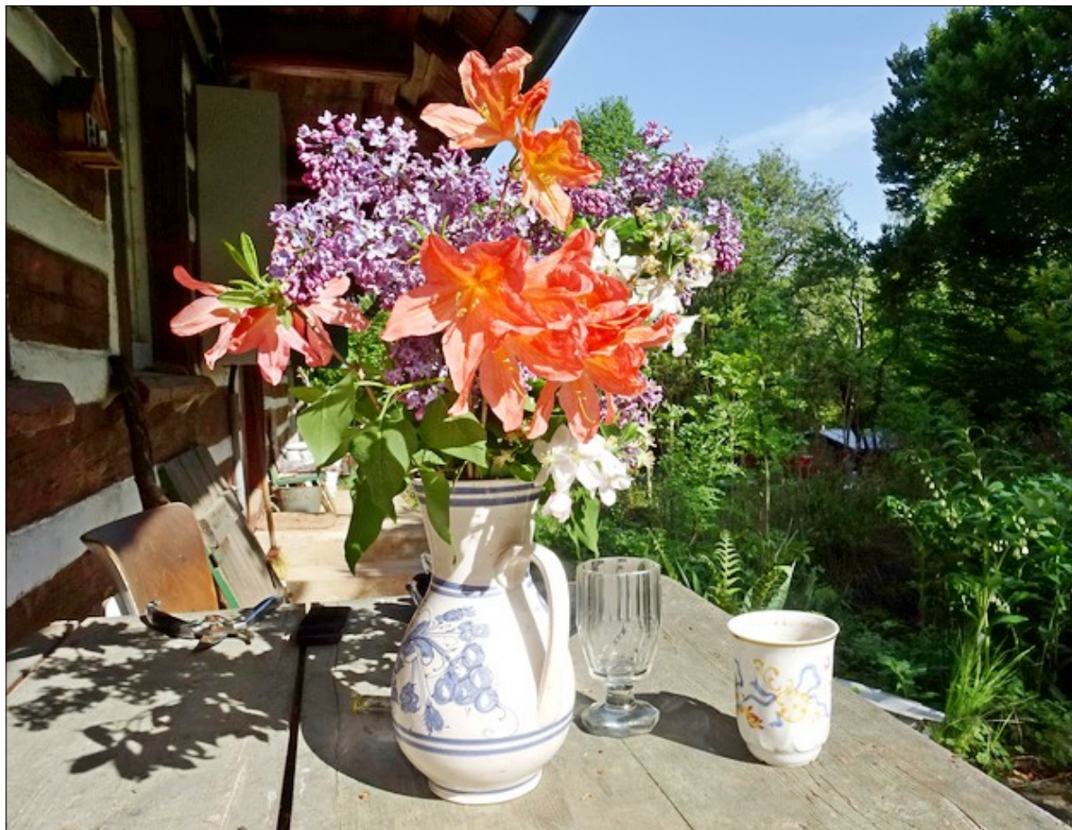
Zátiší z chalupy