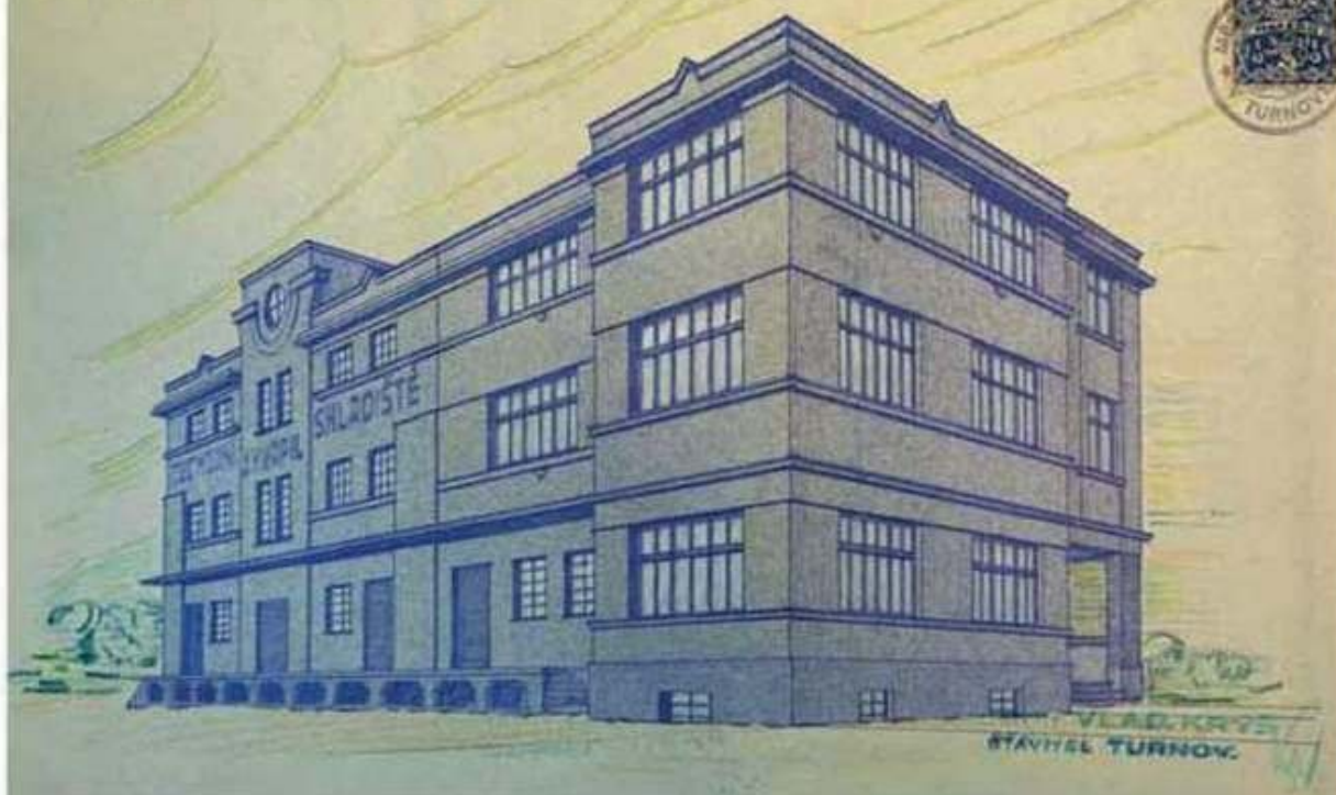
Nedatovaná axonometrie z projektu přístavby a nástavby Kvapilova skladiště čp. 1293 v Krátké ulici (Nudvojovice), realizované v roce 1936, MěÚ Turnov