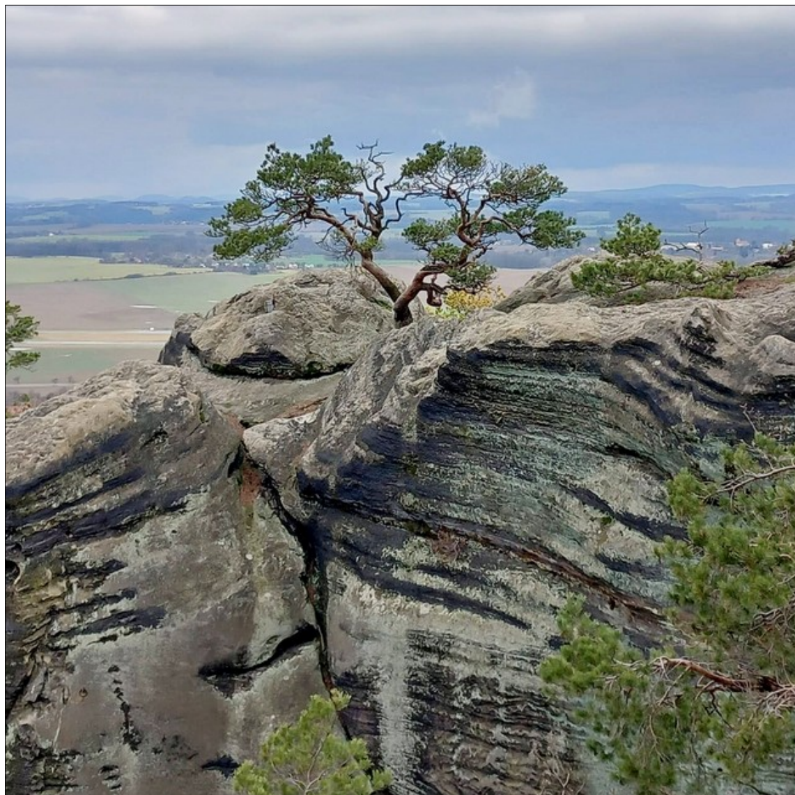
Motiv z Příhrazských skal