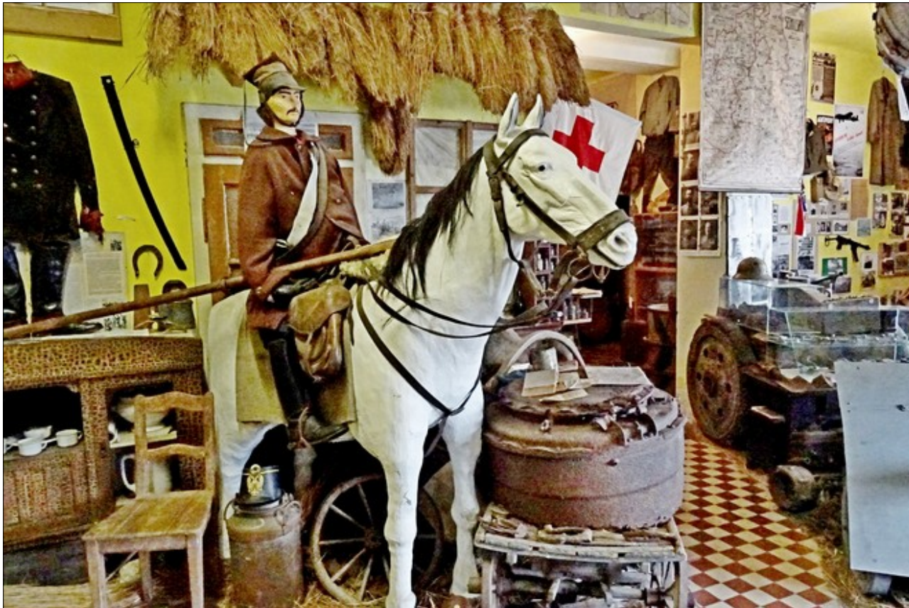
Z Válečného muzea Milana Trakala v Újezdě p/T

Jednu takovou píseň zaznamenal J. Láska z Libštátu: Proč jste neodvedli synka bohatého, proč vy jste odvedli synka chudého. Ten bohatý říká, že je ho škoda a chudý, že není se ztratit doma. Chudobní synkové když se sekají, bohatí synkové z oken se koukají. Chudobní synkové když jdou na vartu stát, bohatí synkové jdou s pannami spát.