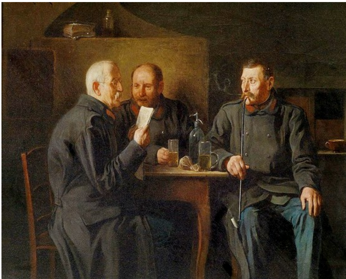
Friedrich Friedländer «Veteranen im Gespräch» (1901)

Po roce 1867 se stala c. k. armáda nejdůležitější institucí v nové „dopelmonarchii“. V době rostoucích nacionálních trendů měla armáda nadnárodní charakter a její důstojníci se cítili být oddáni především svému císaři. Vytvářeli speciální společenskou a sociální skupinu, která se identifikovala s armádou a monarchií. Branný zákon z prosince 1868 zavedl všeobecnou brannou povinnost. Povinná vojenská služba trvala nyní tři roky (u námořnictva čtyři), čímž život a kariéru řadových vojáků tolik neovlivňovala. Proto branný zákon dovoľoval zaměstnat ve státní službě pouze poddůstojníky. Členskou základnu veteránských spolků tak tvořili poddůstojníci c. a k. armády a námořnictva do hodnosti šikovatele (Feldwebel) nebo strážmistra (Wachtmeister).