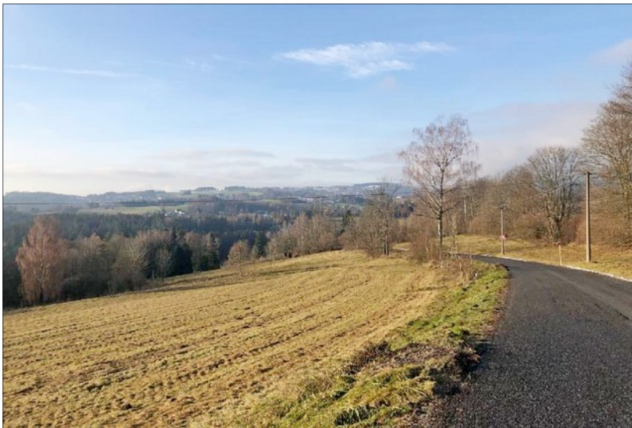
Podzim v Loužnici