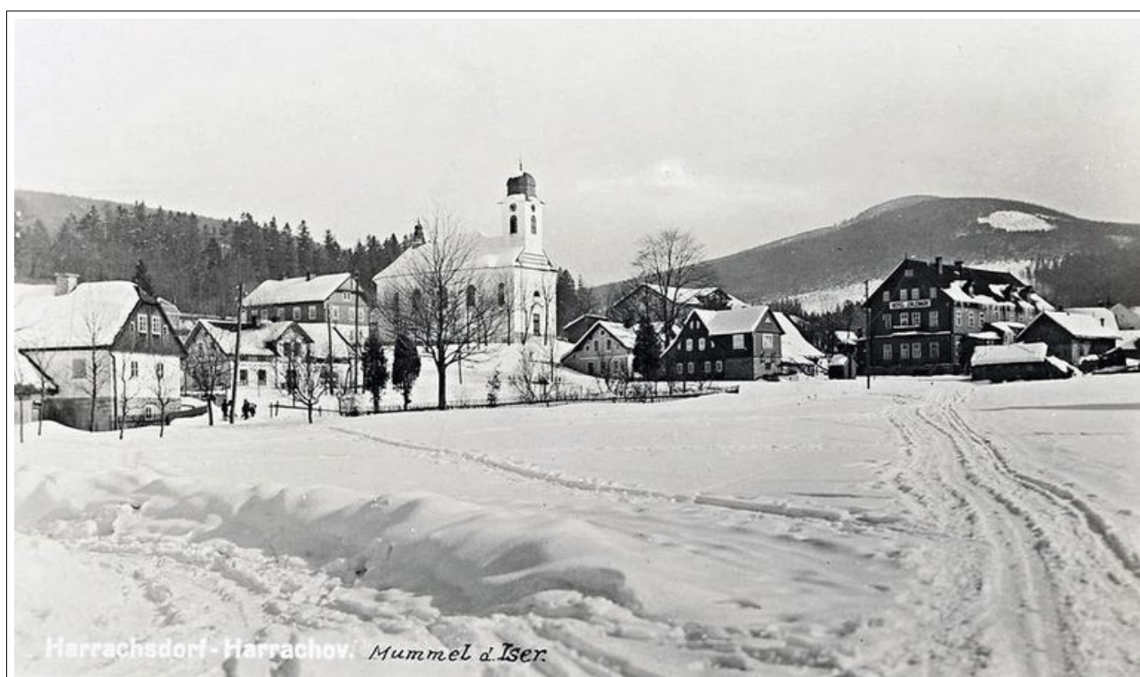
Harrachov. 1929.