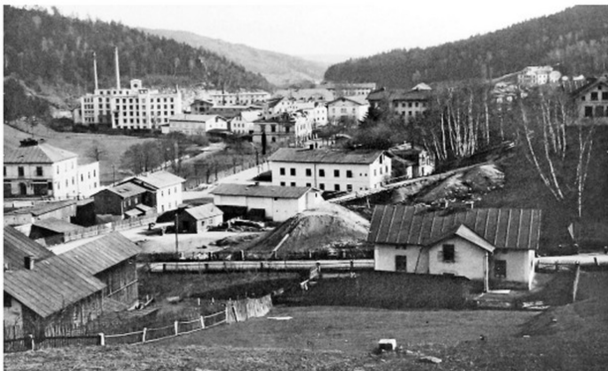
Pohled na část Dolního Tanvaldu u křižovatky dnešních ulic Česká a Nemocniční v roce 1893. V přední části je vidět výstavba kamenné zdi před železničním viaduktem a objekty hotelu Koruna.