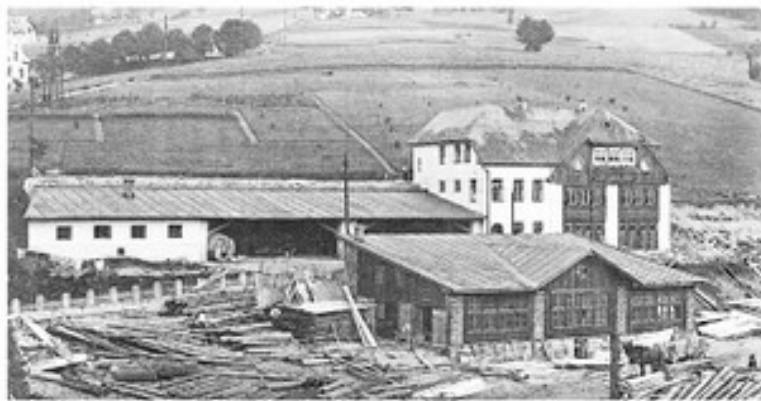
↓ Pohled na horní část vily kráče po přestavbě