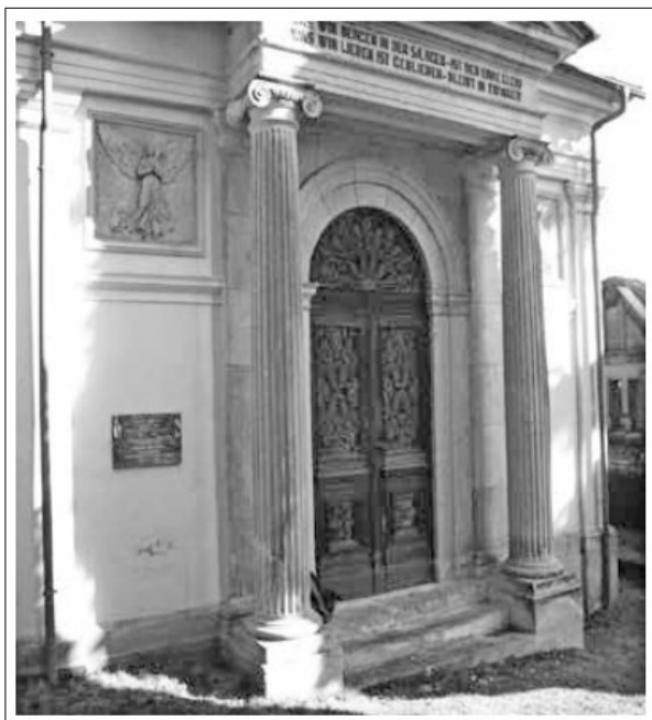
Hrobka Quido Rottera na vrchlabském hřbitově

# K významnému výročí se váží také aktivity vrchlabského Quido Rottera „Když byl v roce 1903 založen „Svaz lyžařů v Království českém“ jako první lyžařský svaz na světě, dal impuls dalším evropským státům k následování. Rád bych v té souvislosti připomněl vrchlabského občana Quido Rottera. V roce 1882 přišel po studiích do Vrchlabí. V roce 1884 zřídil ve Vrchlabí první bezplatnou ubytovnu pro žáky a studenty na světě. S podporou Q. Rottera vznikla v Krkonoších a ostatních částech severních Čech hustá síť mládežnických ubytoven. Toto bylo inspirací pro vznik ubytoven také v alpských zemích a v Německu. V roce 1896 založil lyžařský klub ve Vrchlabí. Založil a vedl spolek „Německý lyžař“ (1898). Roku 1905 byl spoluzakladatelem „Rakouského a německého lyžařského spolku“ stejně tak „Středoevropského lyžařského spolku“, který obsáhl Německo, Rakousko-Uhersko a Švýcarsko. Roku