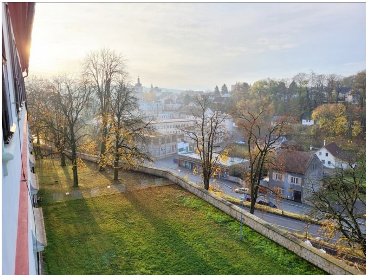
Podzim v Mnichově Hradišti