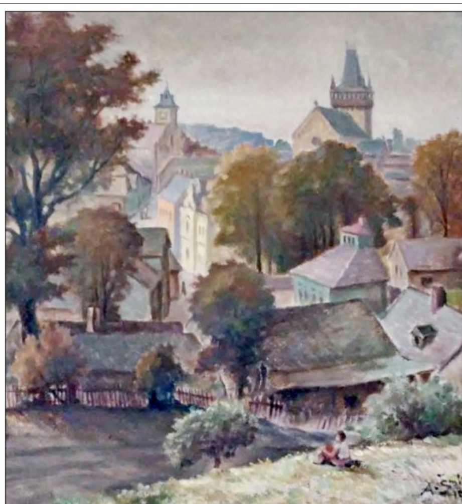
A. Šmíd: Semily, pohled z Koštofranku, olej.