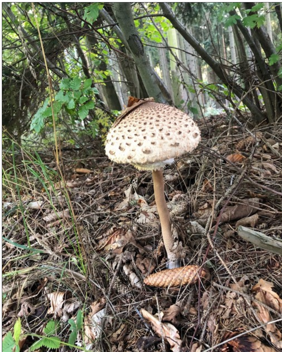
Motiv z lesa