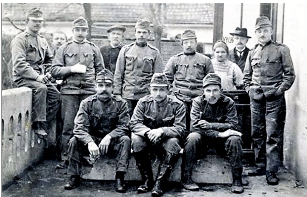
Ranění vojáci, léčící se doma v Modřanech, 1915

V době nedostatku potravin šlo 300 lidí na pole osázení vodnicí velkostatku ruzyňského. Bylo to 1. června k večeru. Každý si natrhal a nabral vodnici. Byli