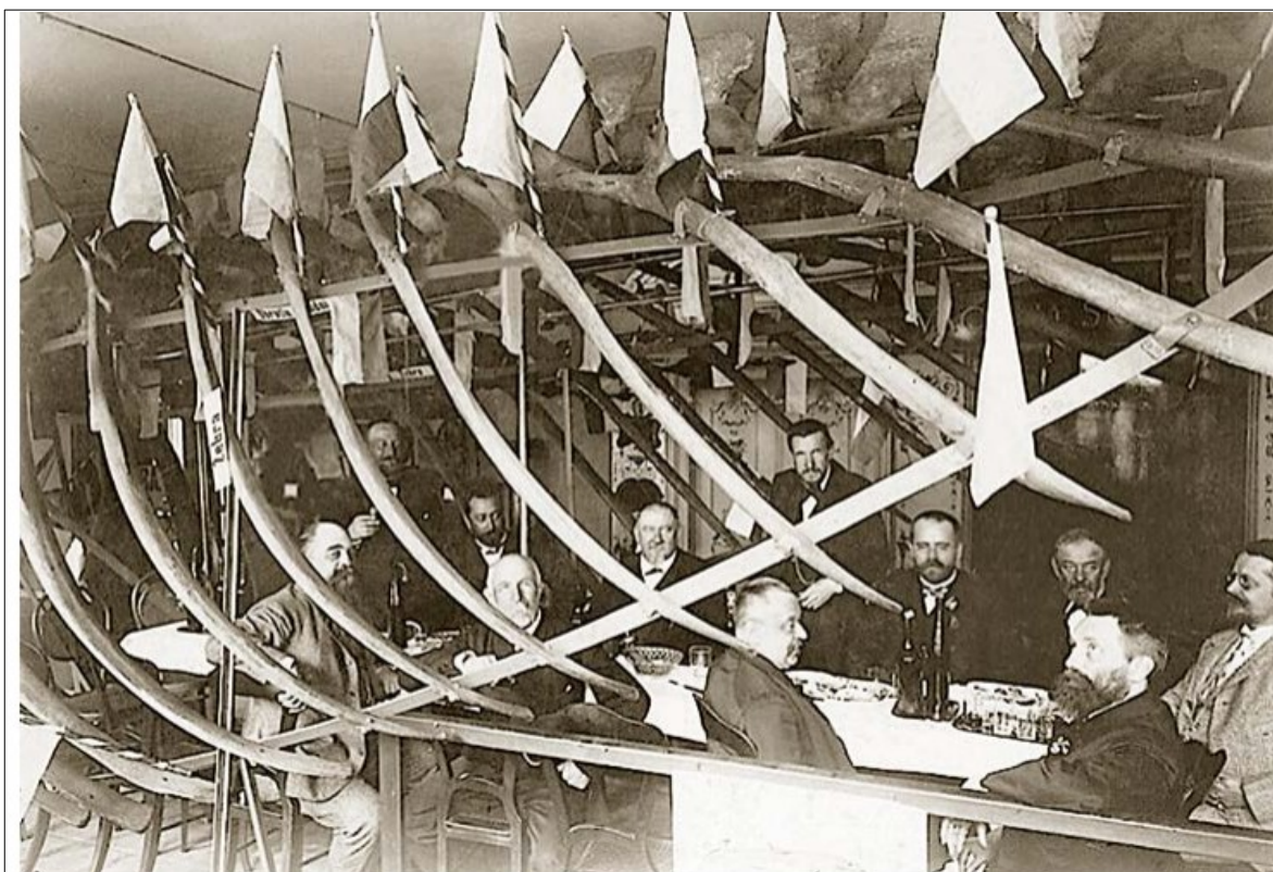
Rozlučkový banket se konal v hrudním koši plejtváka ozdobeného praporky v národních barvách

Výstava byla „za velikého účastenství vybraného obecnstva, zvláště dam,“ zpřístupněna 28. listopadu 1888. „Vidíce kostru velryby před sebou, díváme se tvůrčí síle přírody. Zvíře tak obrovské, jako jest velryba, jest na souši úplně nemožné, což vidíme nejlépe, když velryba uváže na mělčině nebo v zátocě mořské. Jen moře může uživiti podobného netvora, jenž ve svém živlu má neobyčejnou rychlost, neboť žádná ryba se mu nevyrovná,“ poučila druhý den své čtenáře Národní politika s tím, že „život tohoto netvora není dosud úplně prozkoumán“, což ostatně umožnilo redaktorům listu líčit jeho schopnosti v těch nejsenzačnějších barvách: „V ocasu jeho jest taková síla, že dovede jím vyhoditi i loď. V jistém případě táhla harpunou do ocasu raněná velryba loď po dva dny, až konečně provaz se přetrhl.“ Není divu, že se Pražané na výstavu jen hrnuli. Ačkoli České průmyslové muzeum nebylo muzejní institucí, jak si ji představujeme dnes, ale otevíralo jenom dvakrát do roka, protože šlo ve skutečnosti o soukromý dům Vojty Náprstka, přišlo se na velrybu během čtyř let podívat 42 tisíc návštěvníků.