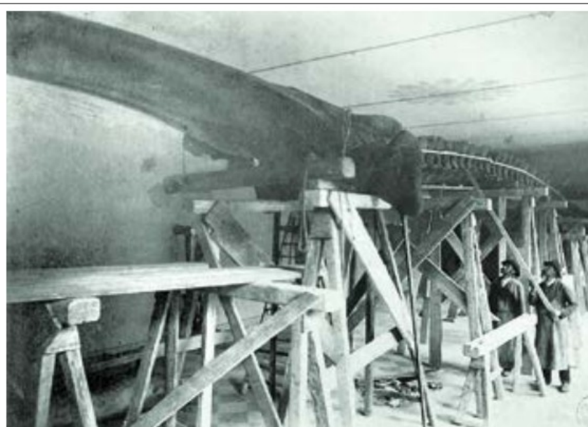
Složení kostry trvalo profesoru Fričovi několik měsíců

Dobrá věc se v každém případě podařila a na jaře roku 1887 už putovala velrybí kostra lodí z norského Bergenu do Hamburku.