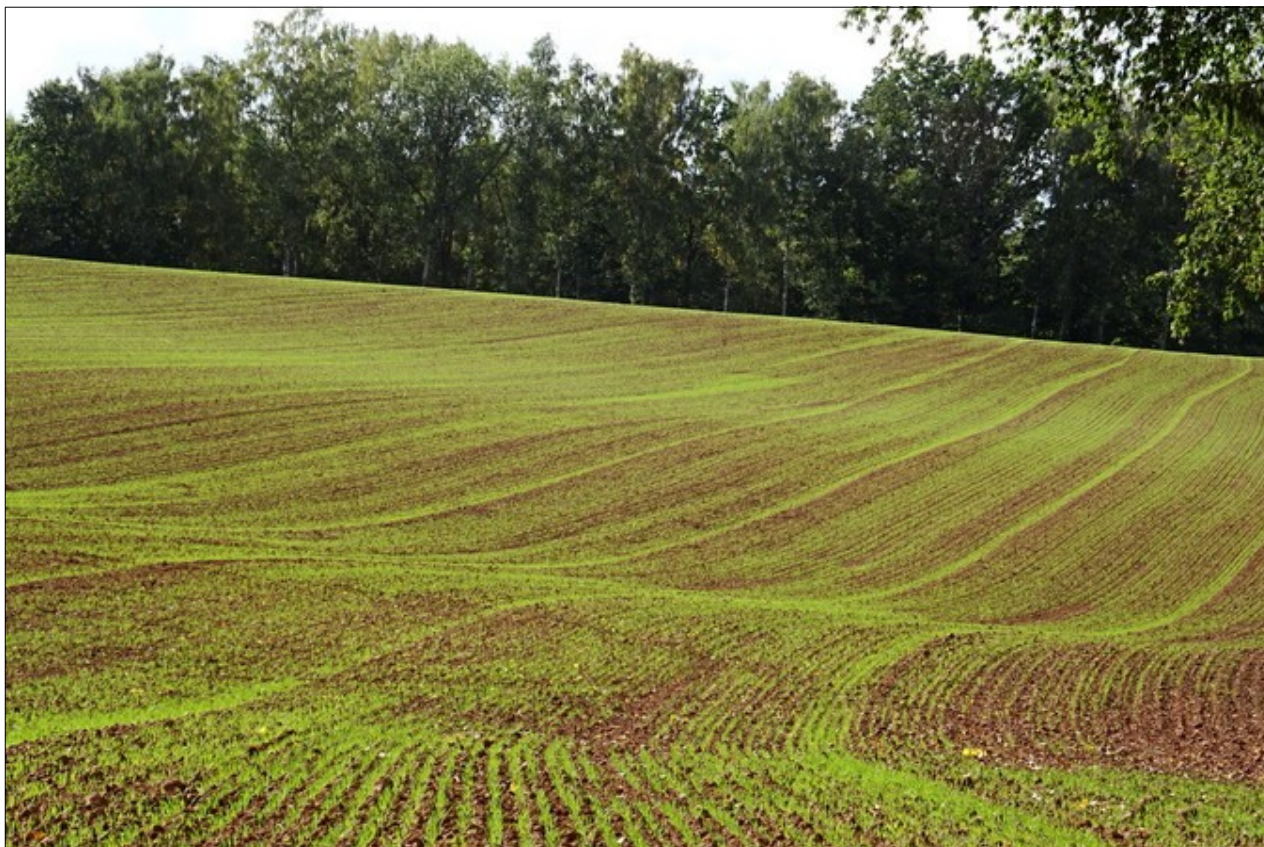
Podzim v Rovensku