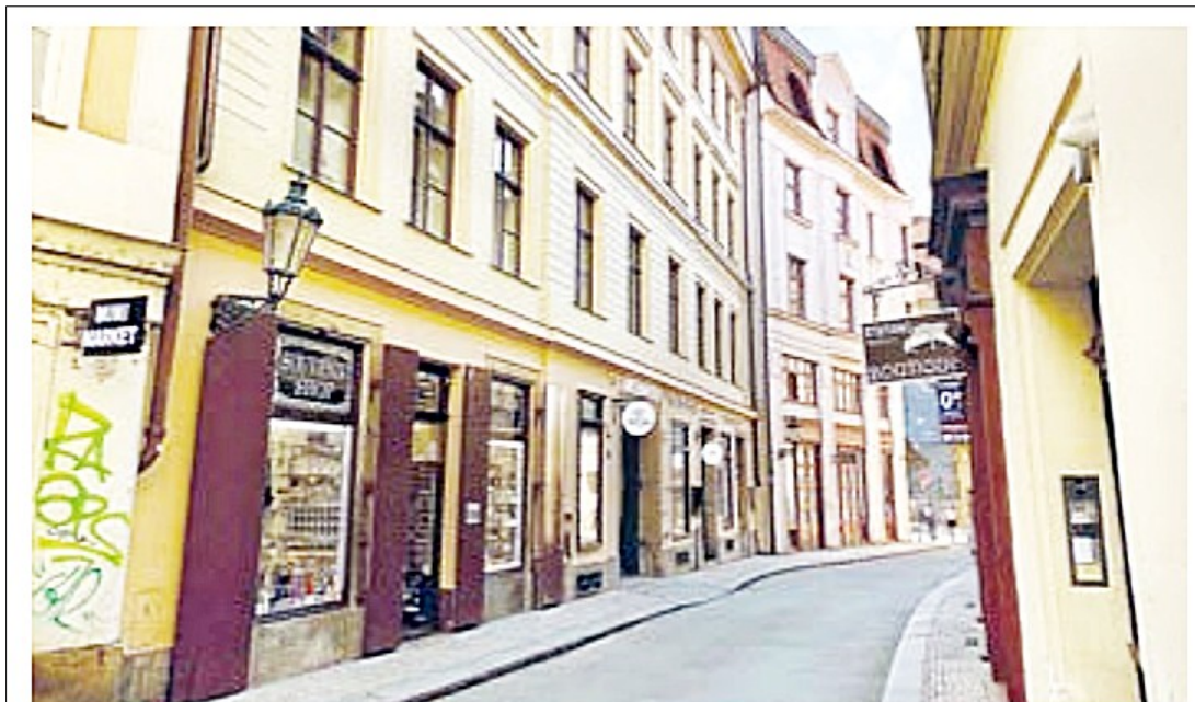
Uggého taliány se vyráběly v Rybné ulici 650/3

Ač po otci Ital, stal se Emanuel Uggé přesvědčeným českým vlastencem. Patřil mezi zakladatele Sokola, byl členem mnoha dobročinných spolků, které pečovaly o chudé (mj. náměstkem ředitele Okresního chudinského ústavu) a důstojníkem Měšťanského sboru pražských granátníků .