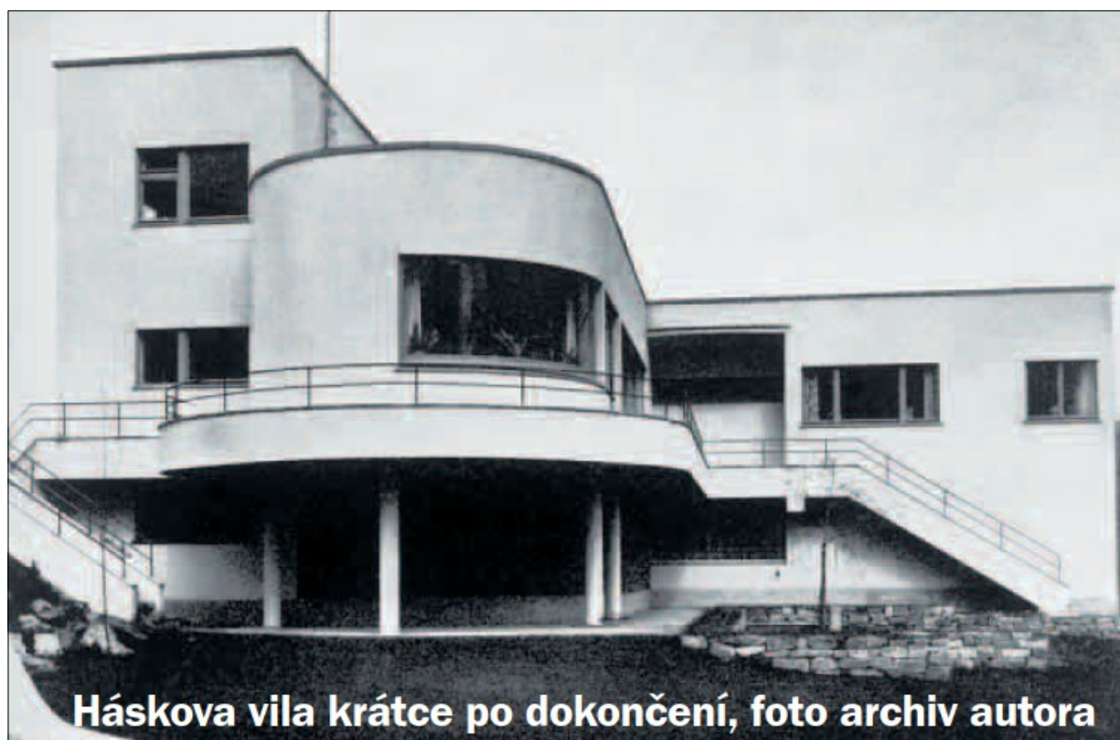
Háskova vila krátce po dokončení

Mšenská přehrada byla Fleissnerovým oblíbeným místem. Nacházela se na hranici mezi Jabloncem nad Nisou a tehdy samostatným městysem Mšeno nad Nisou. V jejím okolí hledal malíř zajímavé motivy pro své grafické listy i malby. Na většině z nich je obrazovou dominantou Priebšchova sklárna, nepřehlédnutelná industriální stavba, v poválečné době bohužel zbořená. V roce 1935 Fleissner namaloval obraz, kterému dal název Sommerlandschaft – Letní krajina . Zachytil na něm přírodní scenérii nad východním břehem mšenské přehrady včetně partie, kde v obklopení pestré zeleně stály moderní vily bratří Rudolfa a Jaroslava Háskových.