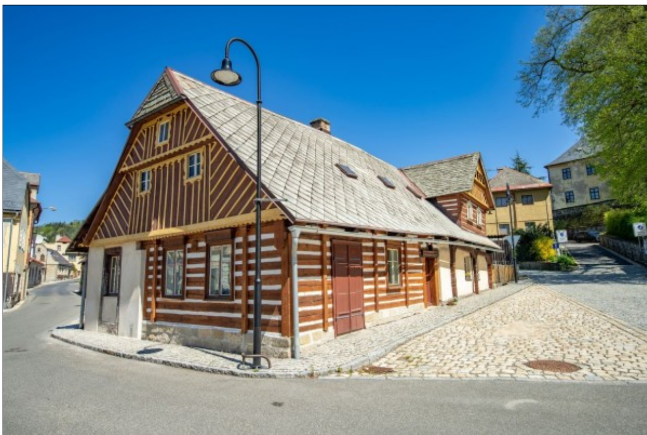
Jechovsko v Železném Brodě

Stačí si rozkliknout fotky na https://www.facebook.com/regionliberec/ a dát symbol like konkrétní památce. Ta, která jich obdrží nejvíc, vyhrává. Tři vylosovaní hlasující pak obdrží ceny. Hlasování trvá do 4. června; cena veřejnosti bude vítězné obnově kulturní památky předána společně při slavnostním ceremoniálu v září.