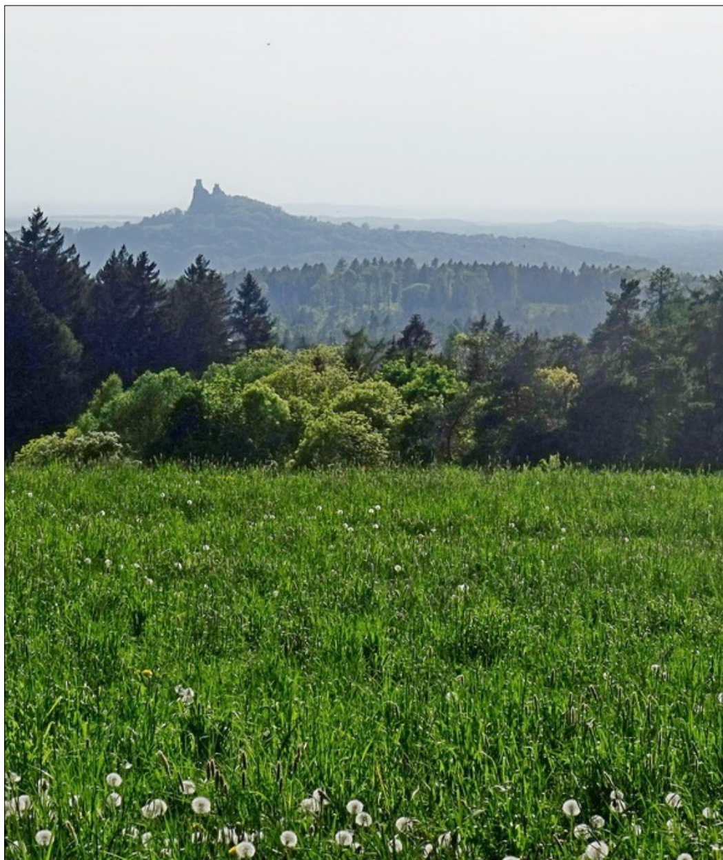
Dominanta od Veselé