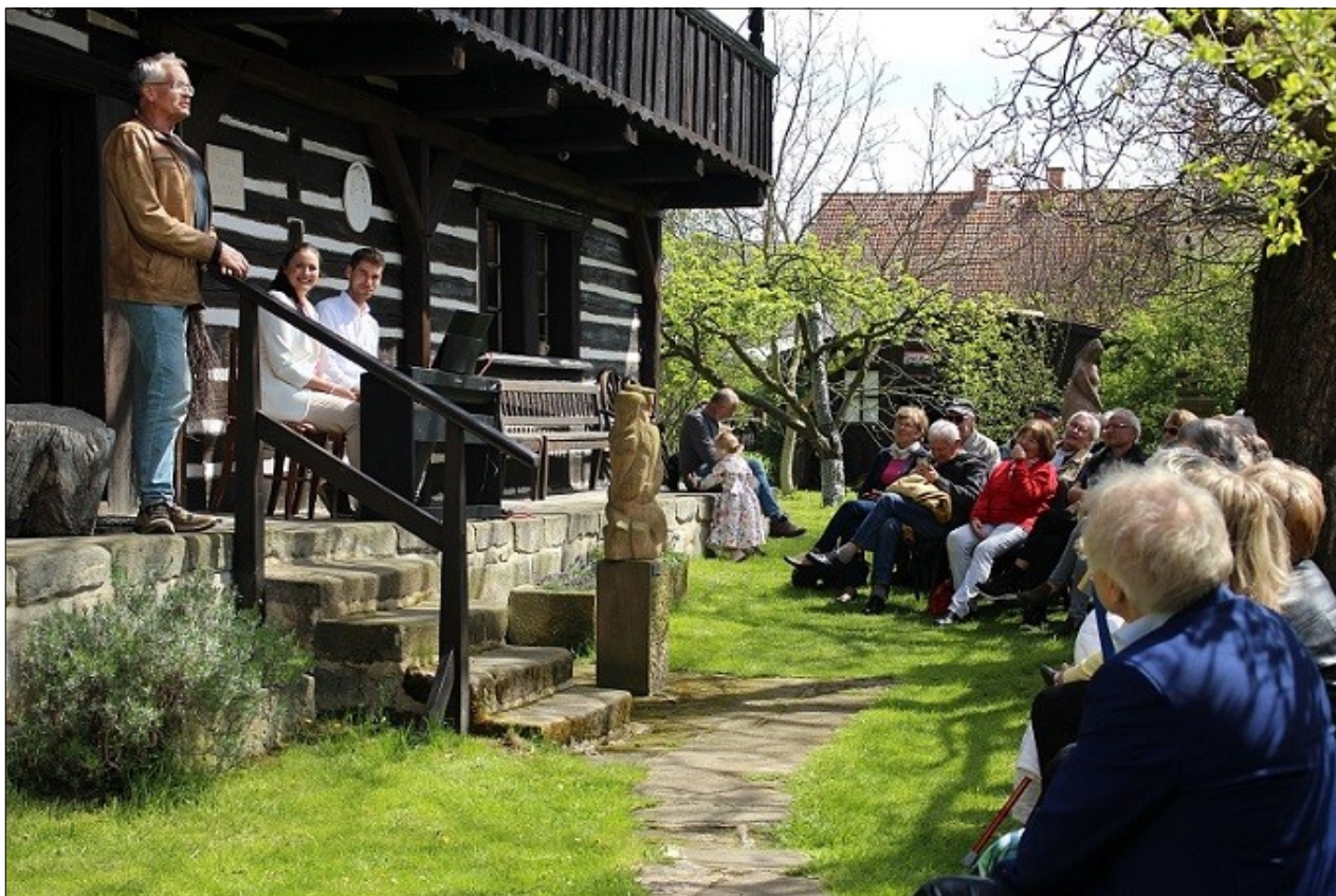
Šolcův statek – jubilejní 50. sezona zahájena!