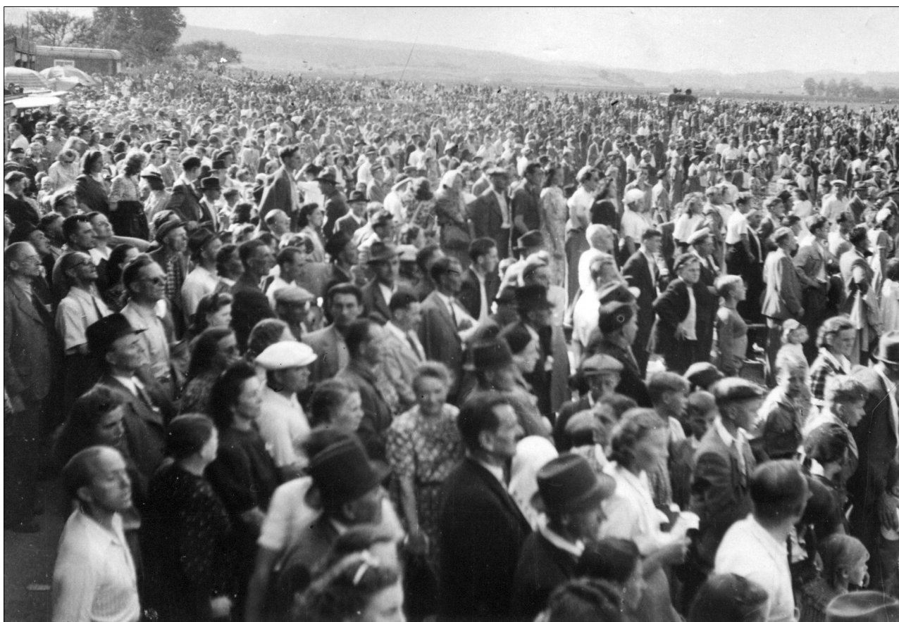
Letecký den na letišti u Vokšic