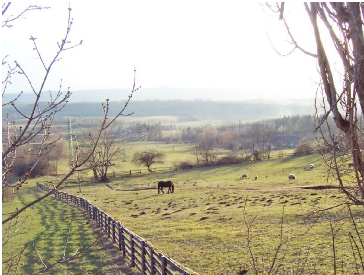
Ze strání Kozákova, směrem k Vyskři – ta se schovává