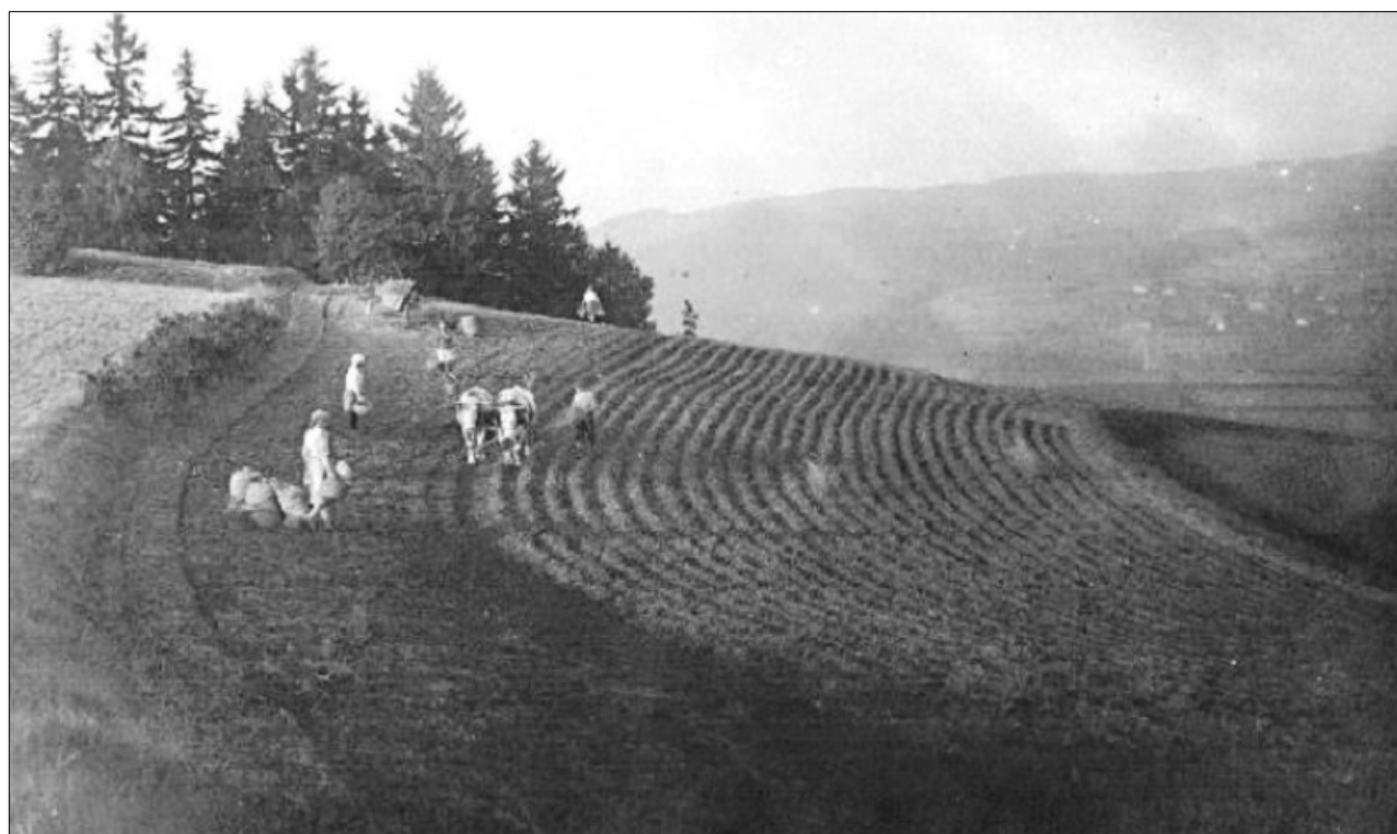
Sázení brambor.