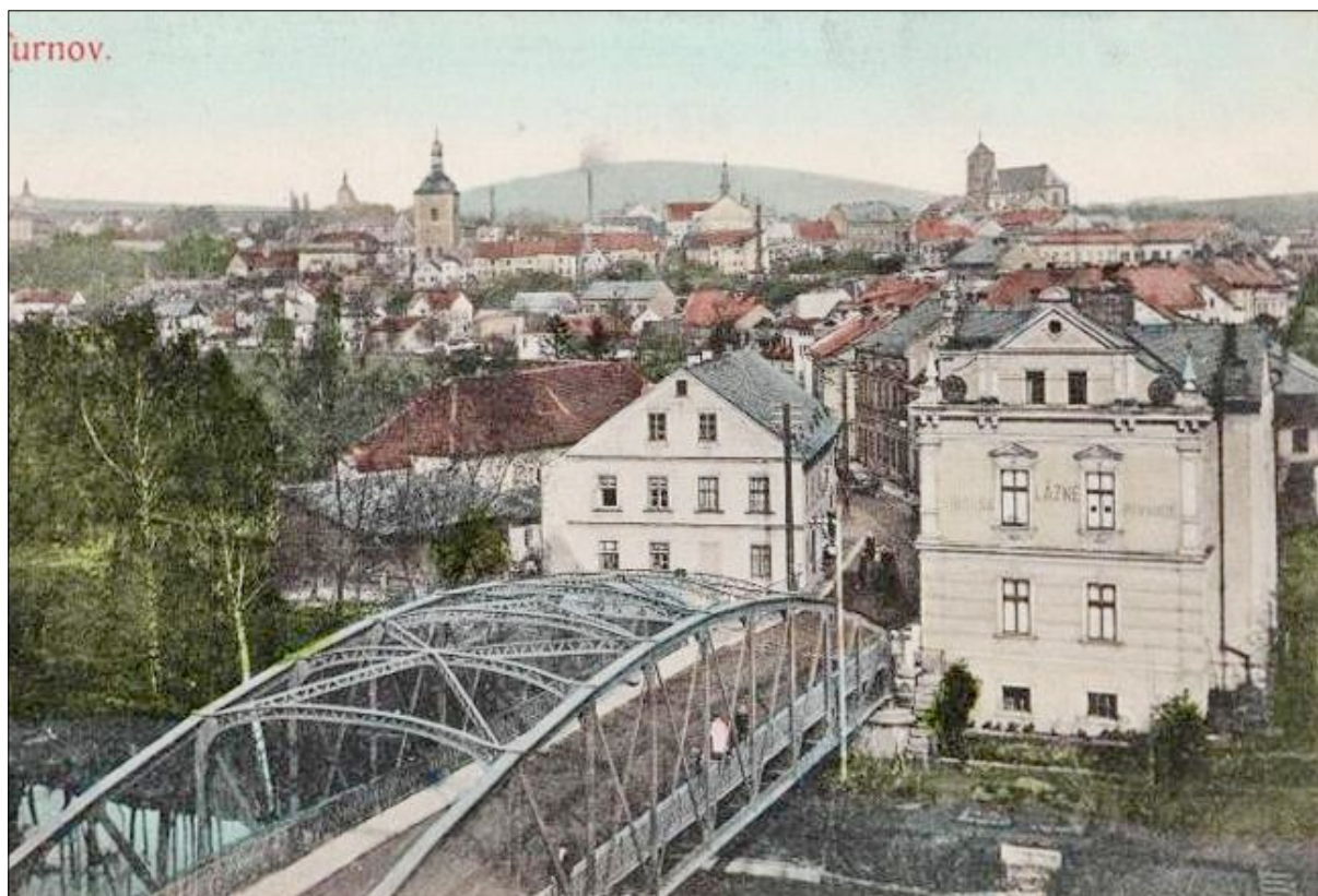
Turnov. Z facebooku Vlasty Salátka