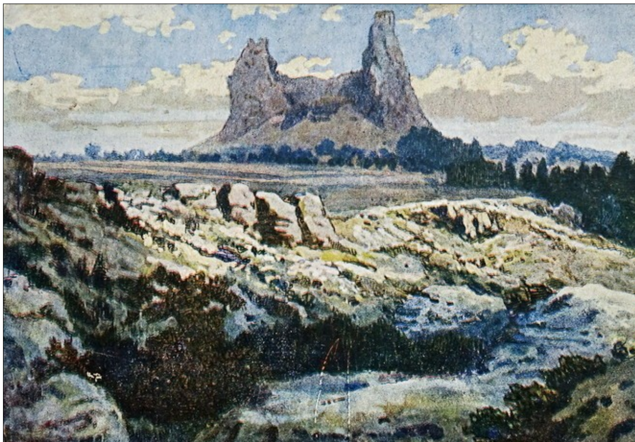
Český ráj: Trosky. Vyd. Minerva Praha. Nedatováno