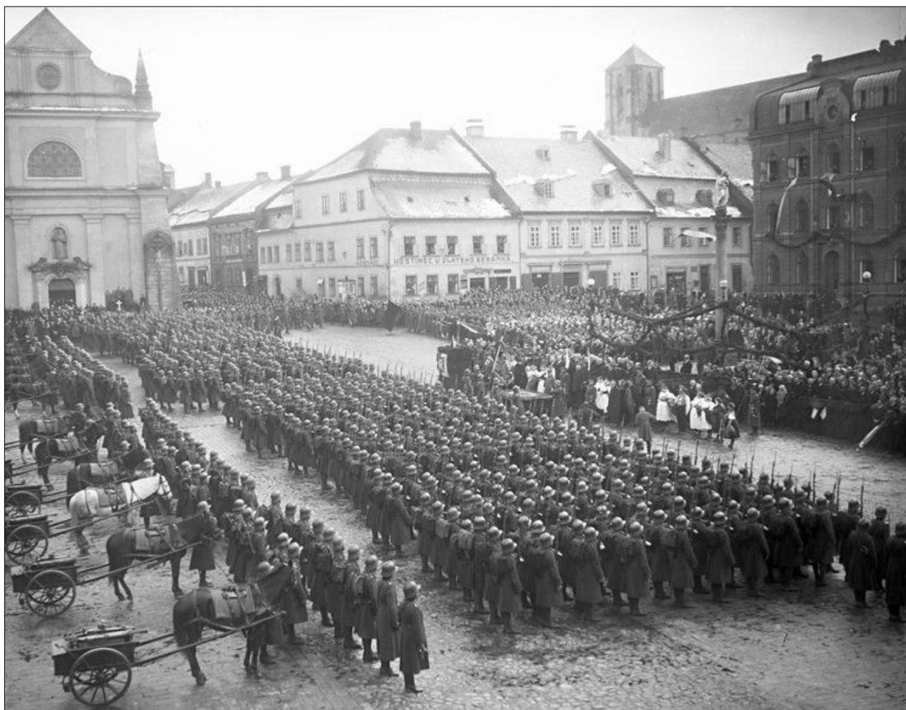
Slavnost předání praporu pěšímu pluku č. 44 na turnovském náměstí 7. března 1926

nímu aktu byly u Viléma Peciny objednány odznaky s vyobrazením centra Turnova, nad nímž je rozvinutý prapor se znakem města.