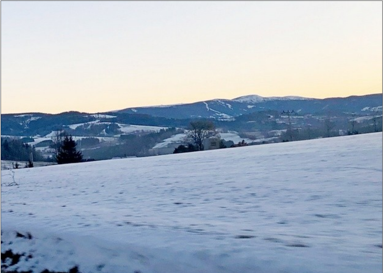
Cestou z Loužnice do Držkova