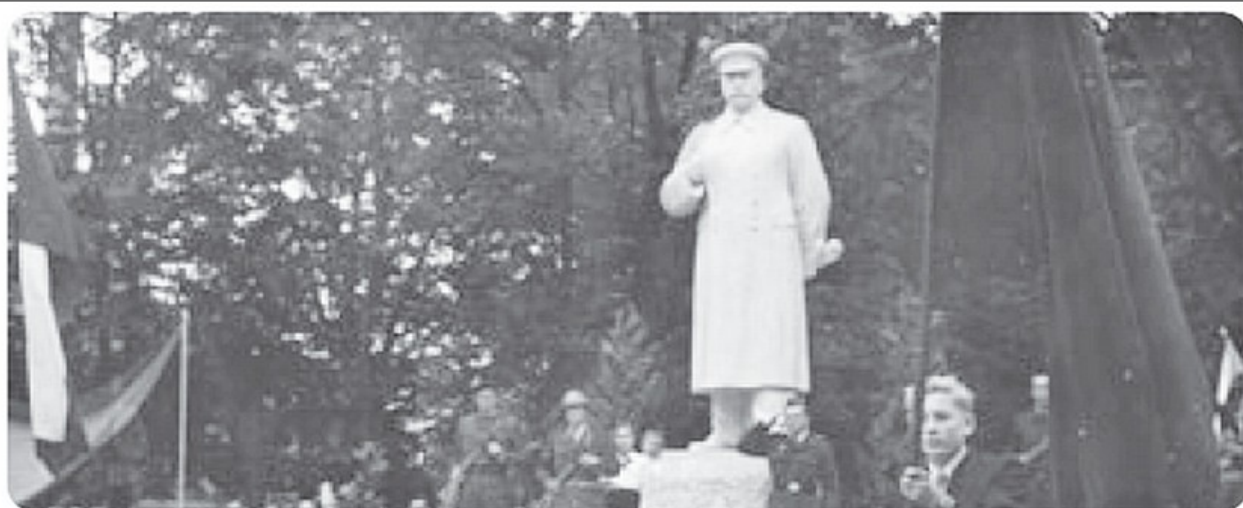
Slavnostní odhalení pomníku 21. září 1952.

O postavení pomníku Stalinovi rozhodli jičínští komunističtí i městští funkcionáři na samém počátku padesátých let. Jako výraz úcty k vrchnímu veliteli sovětských vojsk, která osvobodila převážnou část ČSR od německé okupace, Jičín nevyjímaje. V roce 1952 byl pomník postaven a 21. září téhož roku v rámci bohatých oslav 650. výročí založení města slavnostně odhalen. Tehdy jistě nikdo netušil, že generalissimus za necelého půl roku, 5. března 1953, zemře a zejména, že o tři roky později se svět dozví, že šlo o jednu z nejkontroverznějších osob nejen sovětské, ale i světové historie dvacátého století.