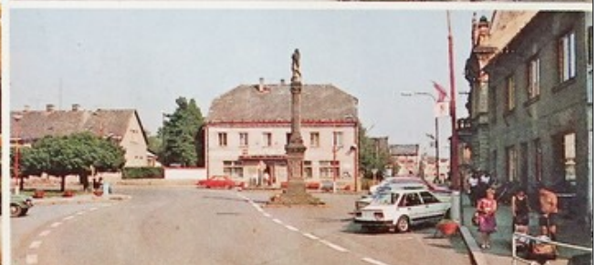
Foto F. Škarvada, J. Morávek. SG Č. Kostelec. Panorama. Nedatováno.