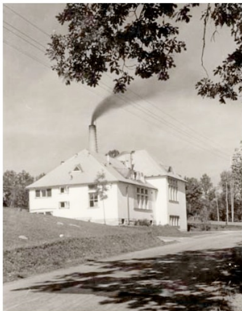
Mlékárna krátce po vybudování.

V roce 1939 byla zahájena výstavba mlékárny v Kruhu u Jilemnice. V provozu pak byla od 28. října 1940.