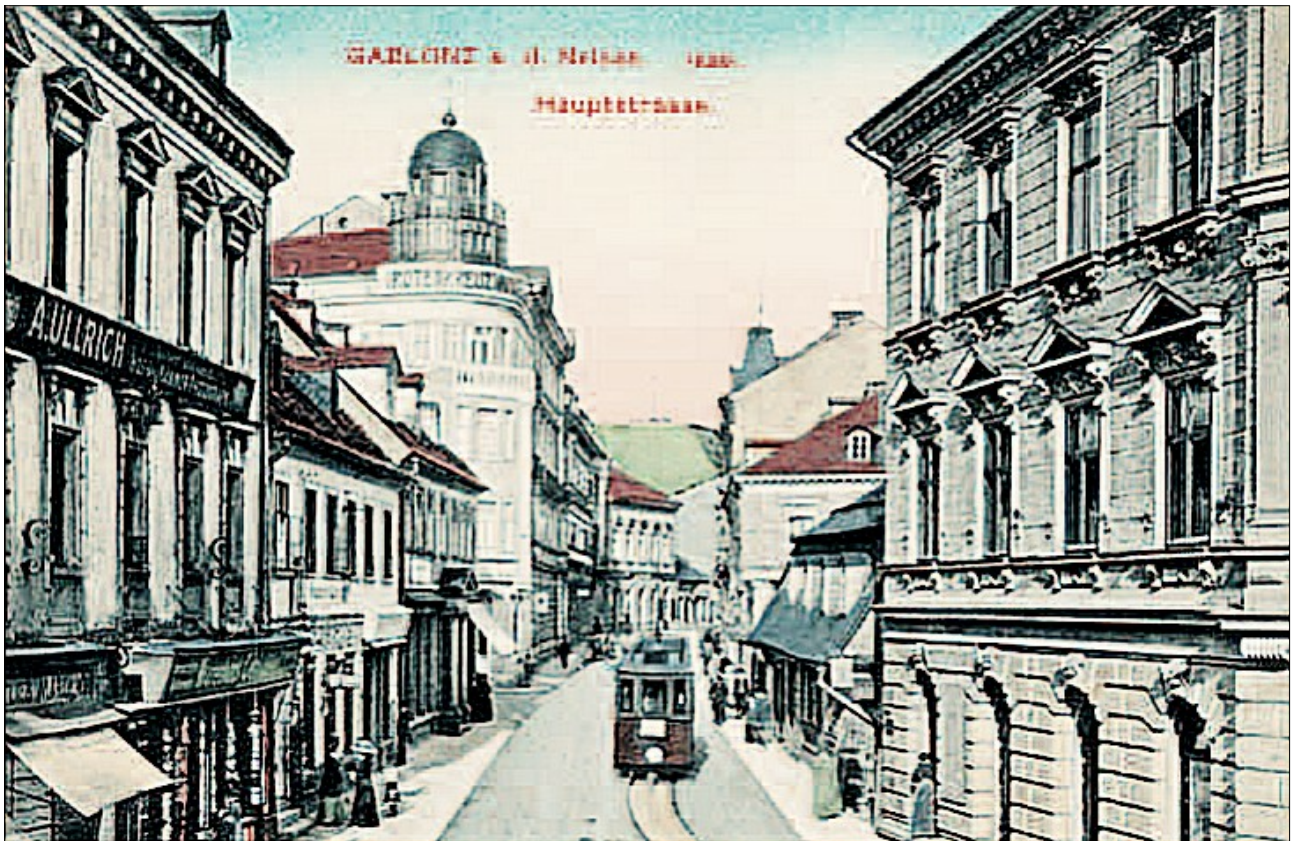
Jablonec n/N. Hauptstrasse.