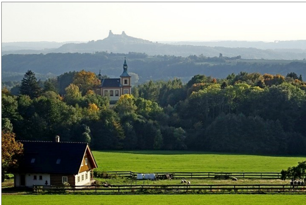
Z úpatí Kozákova