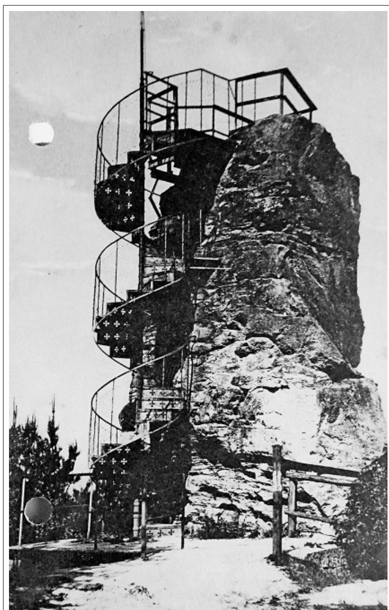
Frýdštejn. (Barborka). VI. Jindra, Praha II. Odesláno 1938