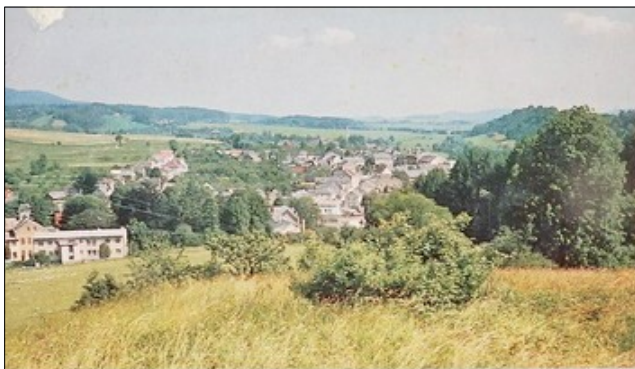
ROVENSKO POD TROSKAMI