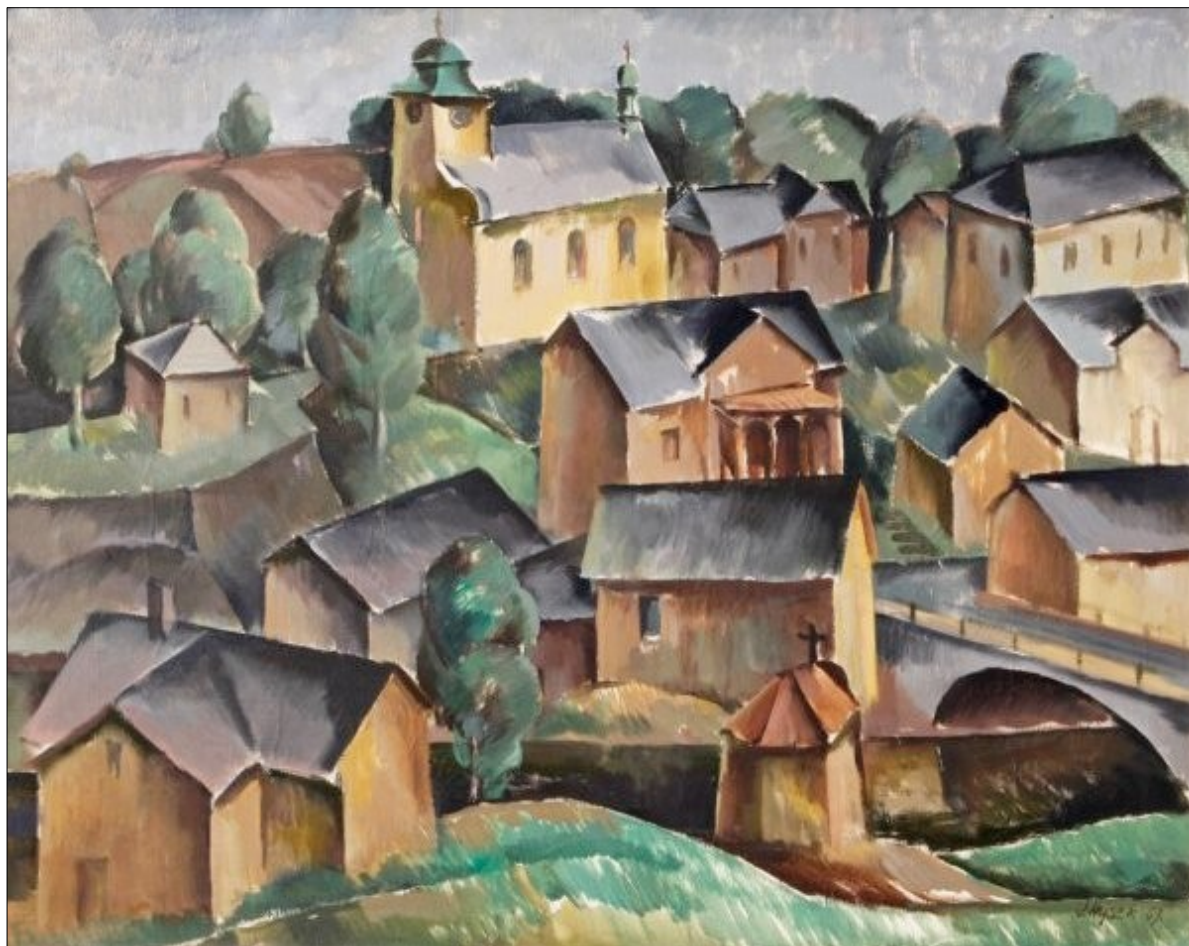
Loukov (1969), Severočeská sbírka

Josef Hýsek namaloval v roce 1962. Obraz je laděn do šedých, hnědých a béžových tónů, které jsou charakteristické pro jeho tvorbu druhé poloviny 60. let. „Dílo v zemitých barvách upoutá mírně pochmurnou atmosférou. Nad ostře řezanými a stínovanými liniemi kopců a domů se tyčí viadukt, jenž je svými mohutnými pilíři pevně ukotven v krajině,“ vysvětlila šéfkurátorka galerie Johana Kabičková. (Jan Mikulička)