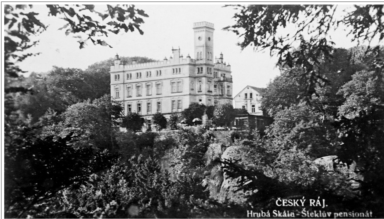
Pohlednice odeslána 1938.