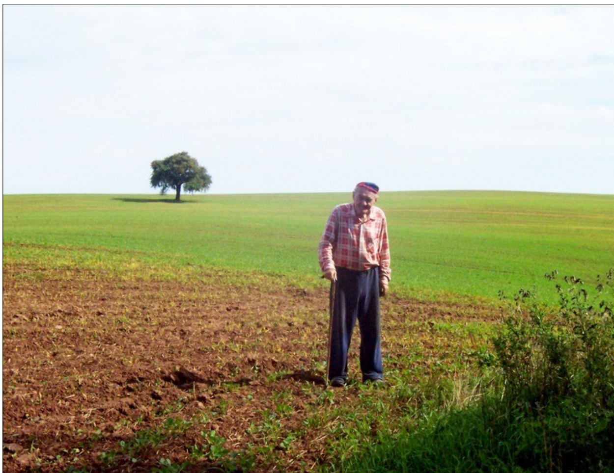
Jablkoň. A táta na poslední procházce do Rovenska, září 2006. Teď by měl 104. narozeniny.