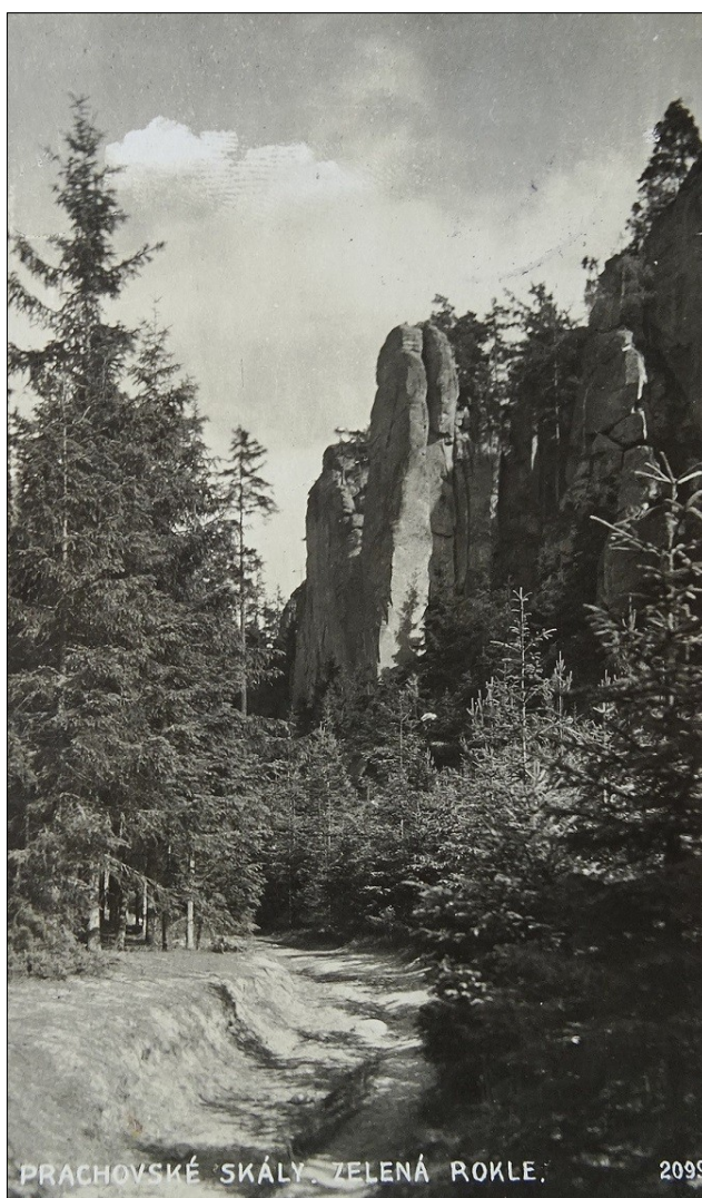
PRACHOVSKÉ SKÁLY. ZELENÁ ROKLE.

Prachovské skály. Zelená rokle. Odesláno 1930, bez dalších údajů