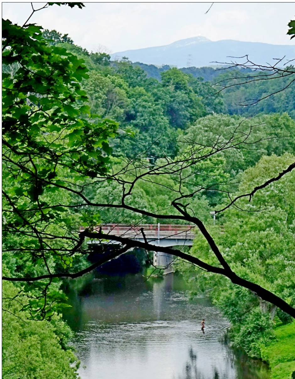
Jizera ze židovského hřbitova v Mnichově Hradišti