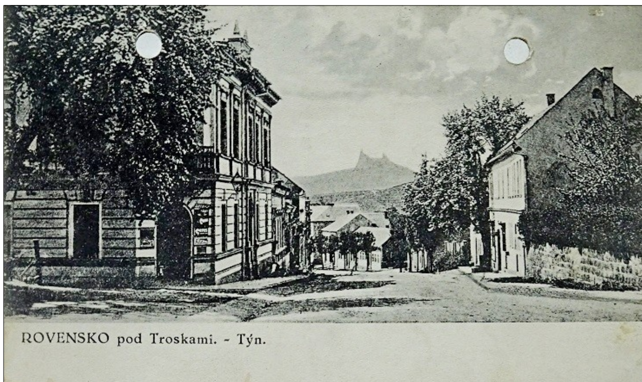
ROVENSKO pod Troskami. - Týn.

boží muka.