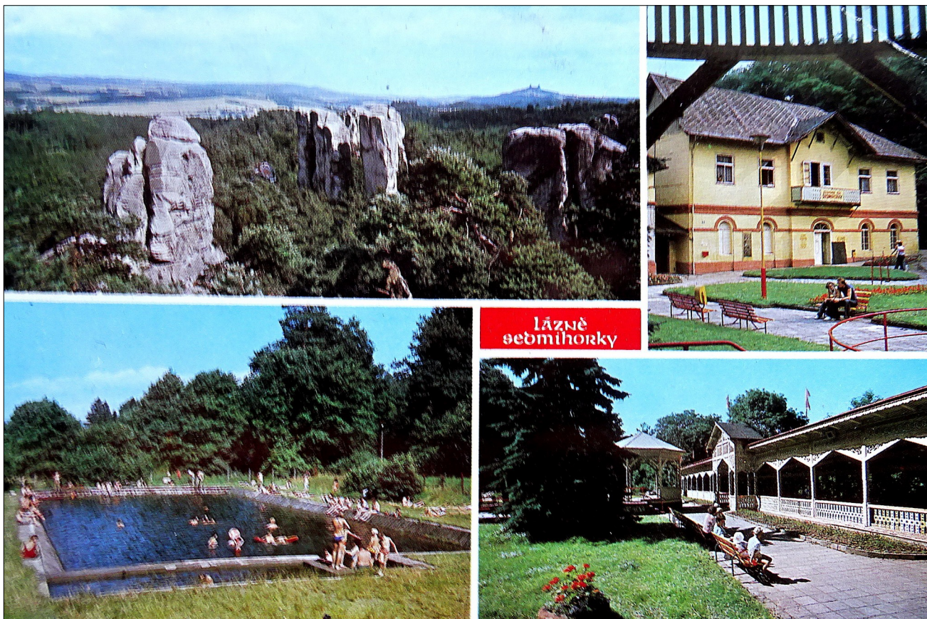
Sedmihorky. Rekreační středisko ROH a vodoléčebné lázně zal. r. 1839. V blízkém okolí je Hruboskalské skalní město a koupaliště. Tisk Severografia Červený Kostelec. Vydavatelství Pressfoto Praha, odesláno 1985