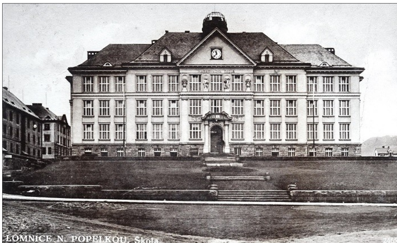
Bez bližších informací, 30. léta