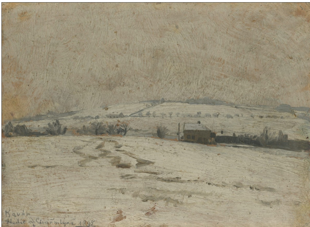
Studie od Císařského mlýna, OG Liberec