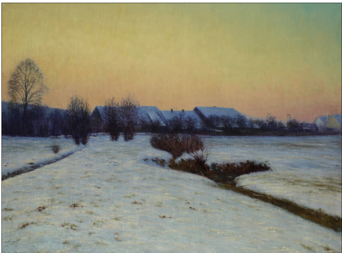
Večer v příprašku, OG Liberec

A hnáty rheumatické, když jen o ně zavadí, vyletěl by z kůže. Ale bylo by potřeba obrázky ještě menší, jako jsem dělával, aby se něco lépe chytilo (jenže nejsou už takové oči) a podle nich aspoň větší malovat mám, však tmavý – zvláště v zimě – barec a žádný atelier, ale hlav- ní a hlavně: ty vítanovské mrazy