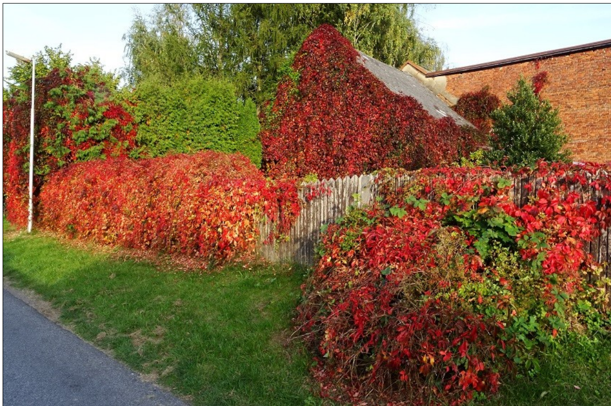
Podzim v Rovensku