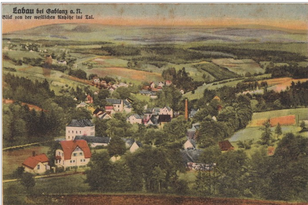
Huť na staré pohlednici