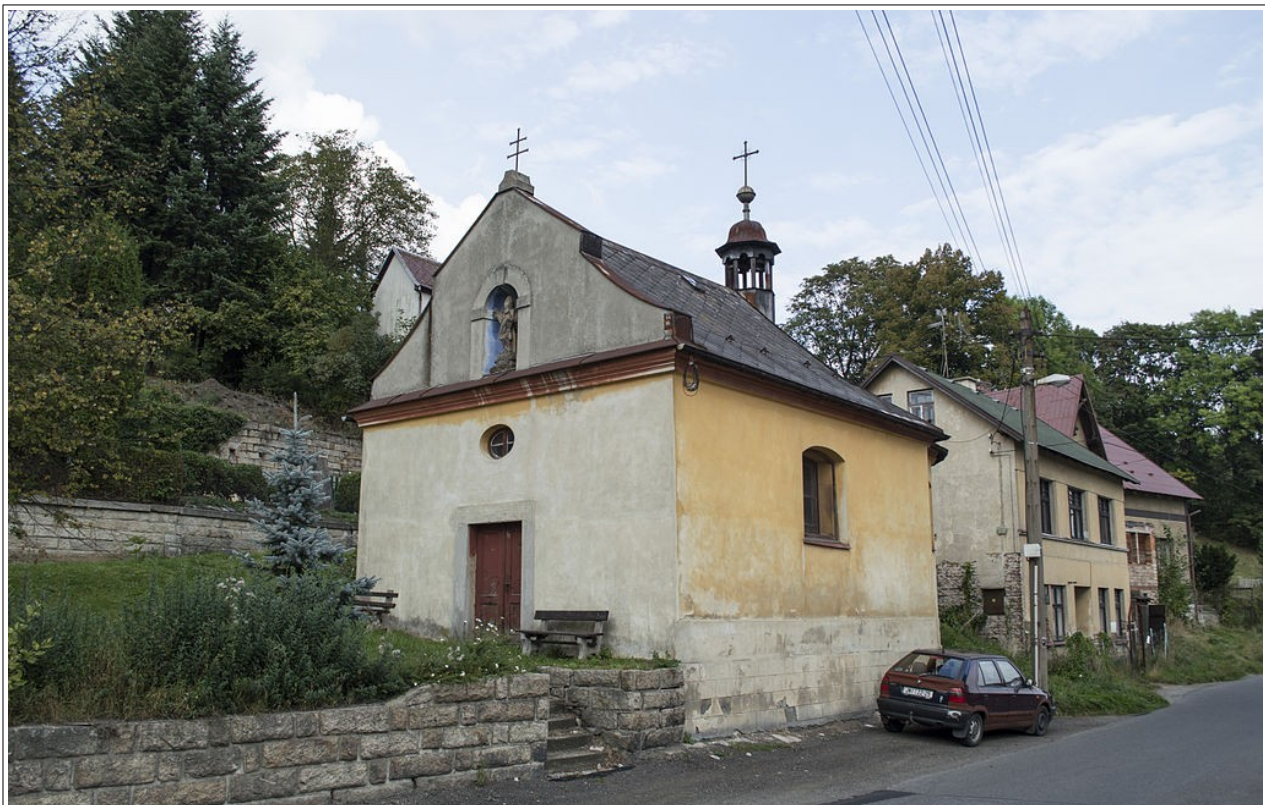
Kaple sv. Vojtěcha, foto Dominik Matus/ Wikipedie