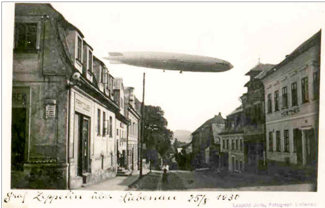
Vzducholod' nad Hodkovicemi