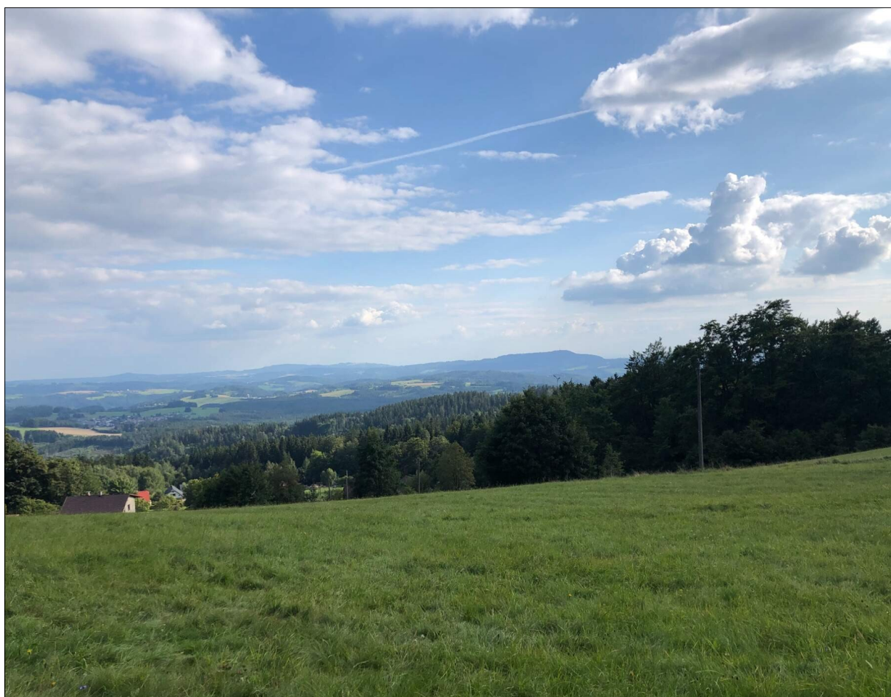
Pohled z Muchova směrem ke Kozákovu