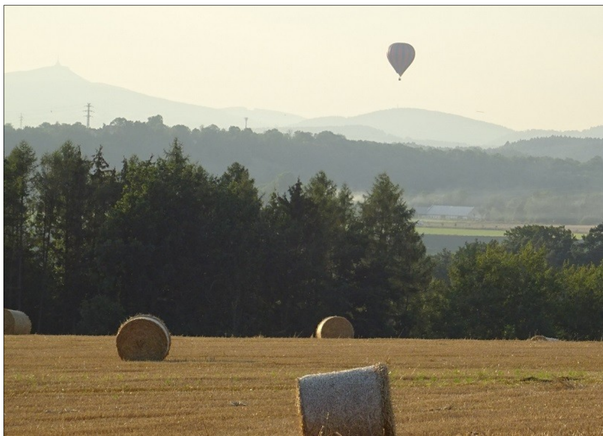
Rovensko – V pozdním srpnovém odpoledni

Turnov: Muzeum Českého ráje po prázdninách * 130 let lomnického muzea Semily * Kumburk * Most v Poniklé památkou * Železný Brod * Líšný Jičín: Jezuitská kolej * Mn. Hradiště: lávka od Pleskota * Hemmrich v Jablonci