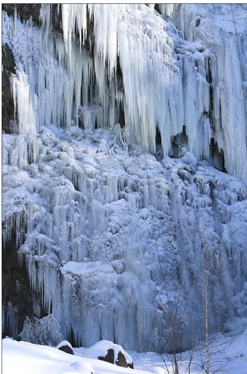
Zima na Kozákově