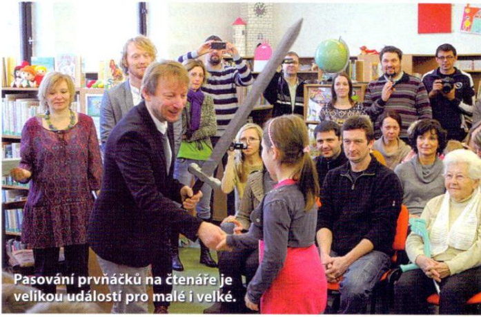
Pasování prvňáčků na čtenáře je velkou událostí pro malé i velké.