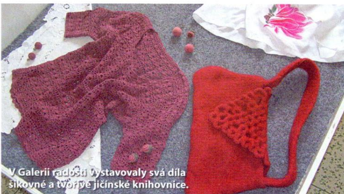
V Galerii radosti vystavovaly svá díla šikovné a tvořivé jičínské knihovnice.